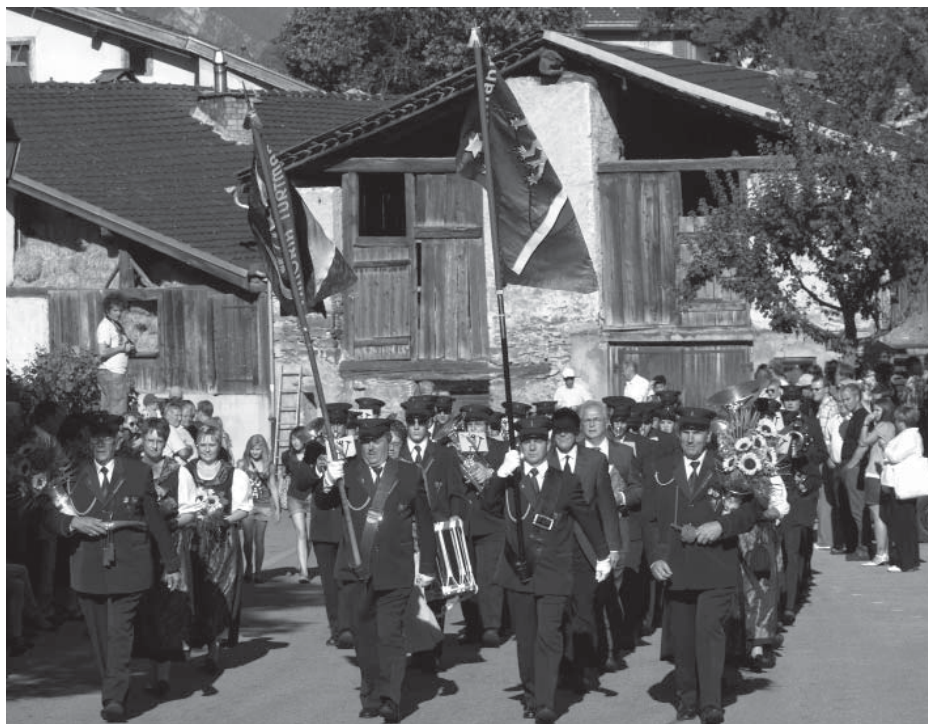
Fahnenweihe, 31. Juli 10

Die MG Turtmann hat eine bewegte Geschichte. Besonders Interessant ist der Beiname „Viktoria“. Mit dem Artikel über die Viktoria möchten wir Ihnen, liebe Leserinnen und Leser, den Gastverein etwas näher bringen.